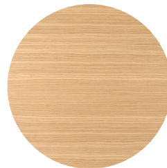
CHÊNE BLANC RIFT