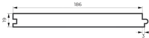
PLAT (STANDARD: RAINURES DE 3MM)

Le substrat de fibre de bois derrière le placage est disponible en couleur noire ou naturelle.